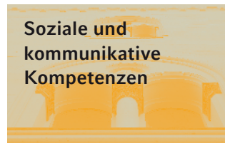
Soziale und kommunikative Kompetenzen