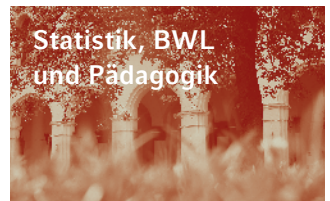
Statistik, BWL und Pädagogik